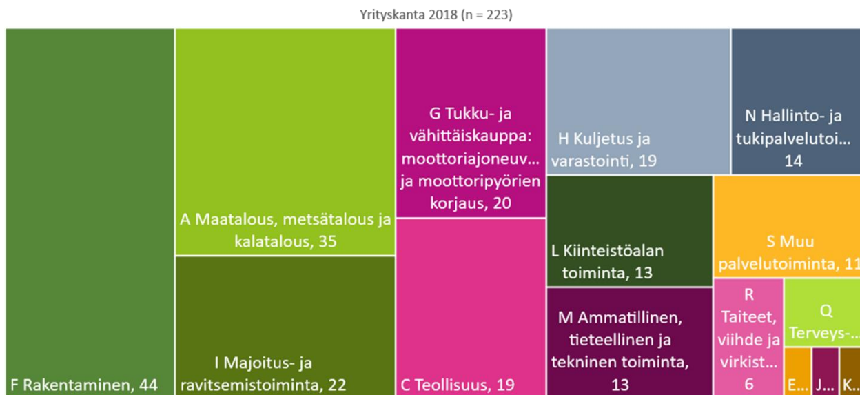
Kuva 2. Yrityskanta Puumalassa vuonna 2018.

ohella. Maa-, metsä- ja kalatalouden parissa on n. 16 % yrityksissä, joista valtaosa sijoittuu metsäsektorille. Joka kymmenes puumalalainen yritys toimii matkailun tai ravitsemustoiminnan parissa.