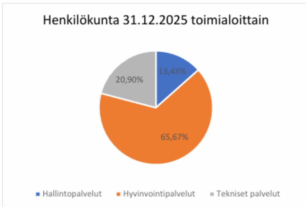
Kuva 1: Henkilökunta 31.12.2025 toimialoittain