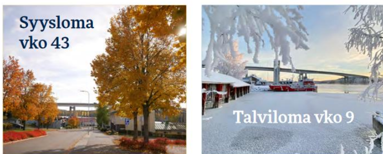
Kuva 2. Syys- ja talvilomaviikkojen ajankohdat.

Puumalan kansalaisopiston syyslukukausi alkaa viikosta 36 alkaen porrastetusti kurssikohtaisten suunnitelmien mukaisesti. Syyslukukausi päättyy viimeistään viikolla 50. Kevätlukukausi 2024 alkaa viikosta 2 alkaen ja päättyy pääosin huhtikuun loppuun mennessä. Syys- (vko 43) ja talvilomaviikolla (vko 9) ei pääsääntöisesti ole opetusta (Kuva 2).