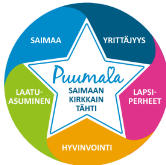
Kuva 1. Puumalan kuntastrategian painopistealueet