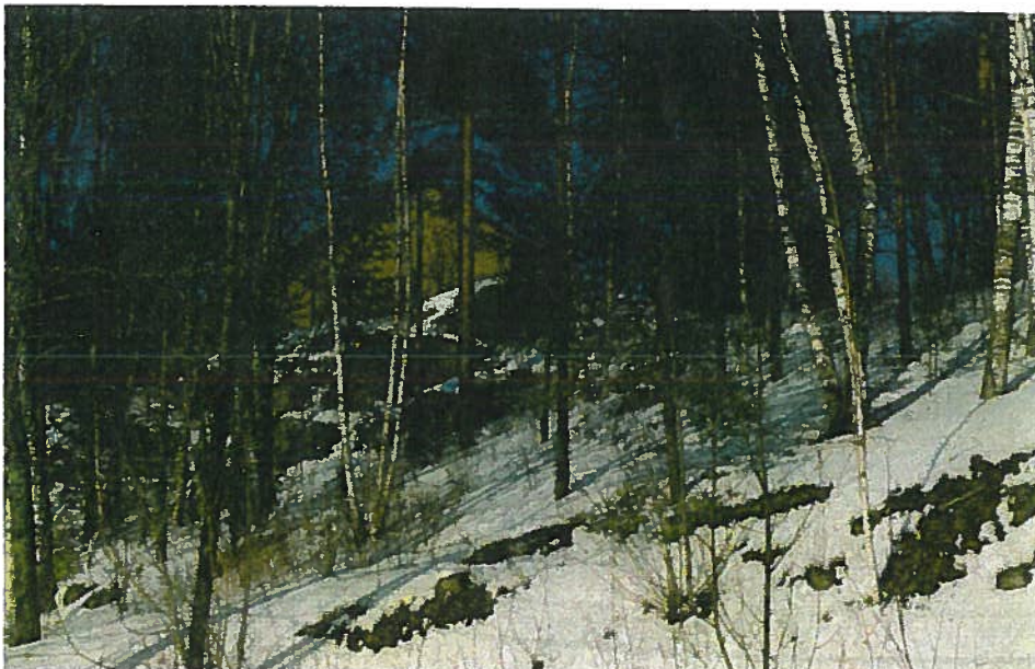
Nuorisotalolle saadaan rannasta yhteys rakentamalla porrastalon eteläpäässä olevaan rinteeseen. Porras voi olla vastaavantyyppinen kuin kunnantalon kohdalle rakennettu.