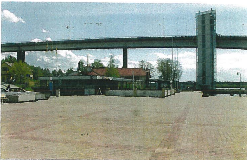
Satamatori ja kahvila nykyisin. Taustalla Puumalan silta. Uusi kahvilarakennus voisi olla Keskustien suuntaan yksikerroksinen ja noppamainen, jolloin rakennus muodostaisi perinteiseen tapaan kiinteän osan katunäkymästä, mutta ei vielä peittäisi järvinäkymää.