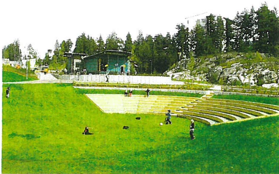
Rinteeseen rakennettu auditorio Kipinäpuistossa Helsingissä.