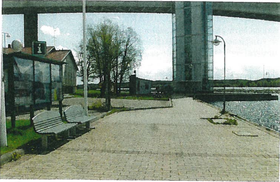
Näkymä rannan kävelytieltä Salen ja Norppapuiston suuntaan. Vasemmalla ilmoitustaulu, taustalla kesäaikana käytössä oleva info-kioski.