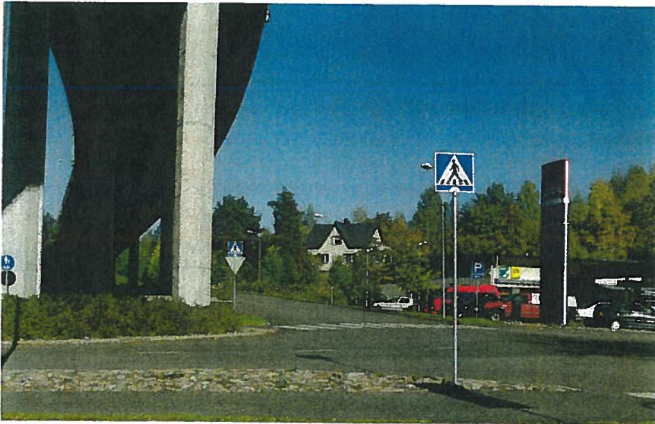
Sillan vieressä kulkevan Lossitien varteen on ehdotettu vinopysäköintiä. Samalla tie muutettaisiin yksisuuntaiseksi.