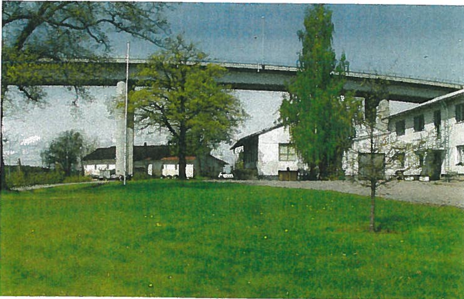
Vanha meijeri rantapuiston reunalla soveltuisi moneen tarkoitukseen. Meijeri on yksityisessä omistuksessa.