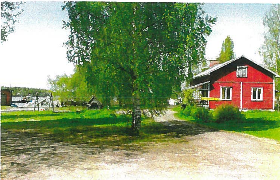
Taunolan talo on hirsirunkoinen. Rakennus voitaisiin peruskorjata erä- ja melontakeskuksen käyttöön.