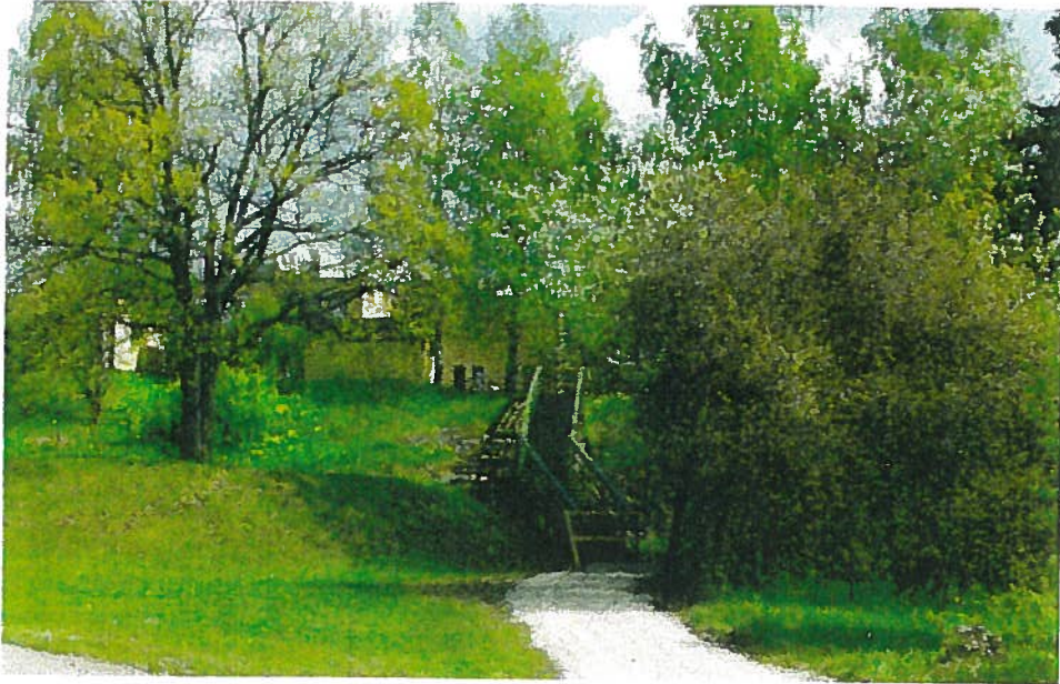
Kunnantalon kohdalle on rakennettu porrasyhteys rannan ja Keskustien väliin.