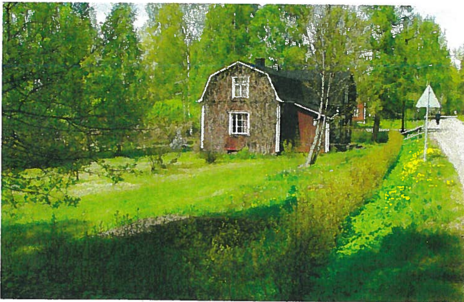
Salosen idyllinen talo ja pihapiiri soveltuisivat kesäkahvilakäyttöön.