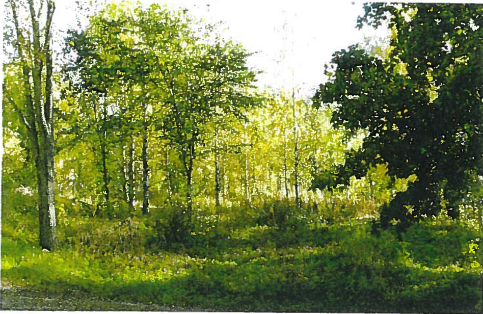
Veteraanipuiston lähelle on ehdotettu paikkaa kesäteatterille ja laulupuistolle.