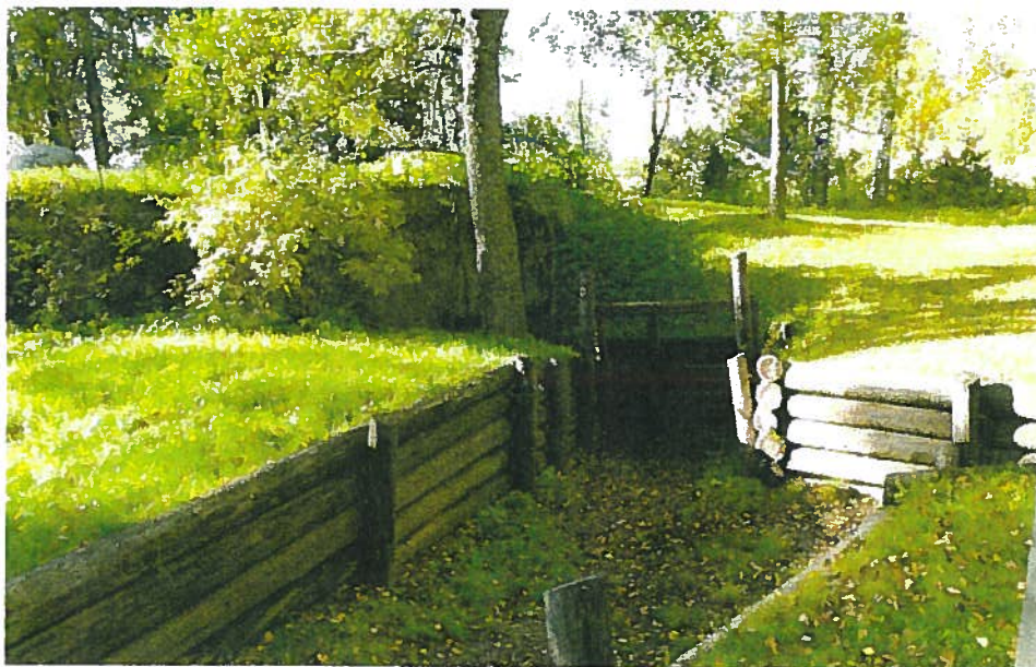
Veteraanipuiston rakenteita on kunnostettu talkoilla.